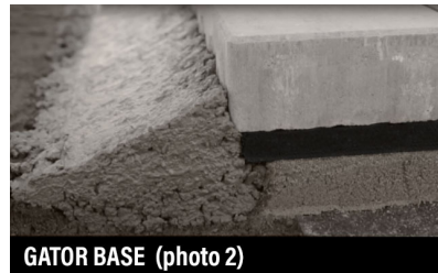
GATOR BASE (photo 2)