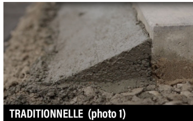
TRADITIONNELLE (photo 1)

Avant la pose de la bordure GATOR XTREME EDGE , consultez la fiche technique (FT) la plus récente du produit, accessible depuis le site AllianceGator.com . Les pavés et les dalles de béton, les pierres reconstituées ou naturelles doivent être installés conformément aux spécifications techniques ( Tech Spec. 2 et pour les applications de recouvrement ICPI Tech Spec. 10 , disponible en anglais seulement) et aux meilleures pratiques établies par l'industrie pour la base, le lit de pose et le drainage d'un projet de pavage.