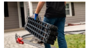
1 paquet = 96 pi. lin.

Étape 3. Lors de l'utilisation de panneaux Gator Base , utilisez des vis Gator Base à tous les deux orifices et à chaque jonction « SNAP & LOCK » pour assurer un soutien latéral continu. Assurez-vous que les bordures GATOR X4 sont fermement installés contre les pavés. Les panneaux Gator Base doivent être plus larges de 15 cm (6 po) que la surface pavée sur tous les côtés.