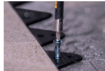
Hauteur de la bordure 15 mm (5/8 po)