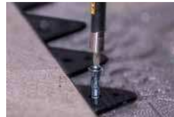
Hauteur de la bordure 15 mm (5/8 po)

Utilisation: La BORDURE GATOR TILE est utilisée pour stabiliser et offrir un fort support latéral sur le périmètre d'une installation de tuiles de porcelaine pour patio, trottoir, pourtour de la piscine et terrasse installé sur des Gator Base et finalement retenue à l'aide de vis Gator Base .