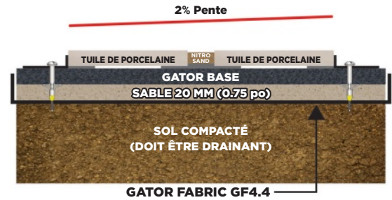
COUPE TYPE D'UNE INSTALLATION DU SYSTÈME GATOR TILE