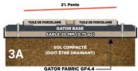
COUPE TYPE D'UNE INSTALLATION DU SYSTÈME GATOR TILE