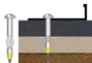
Viti Gator Base