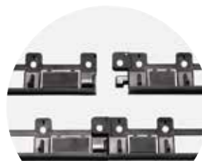
"TWIST & LOCK" SYSTEM