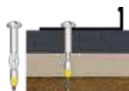
Viti Gator Base