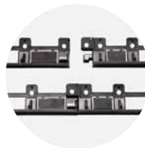
"TWIST & LOCK" VERBINDINGSSYSTEEM