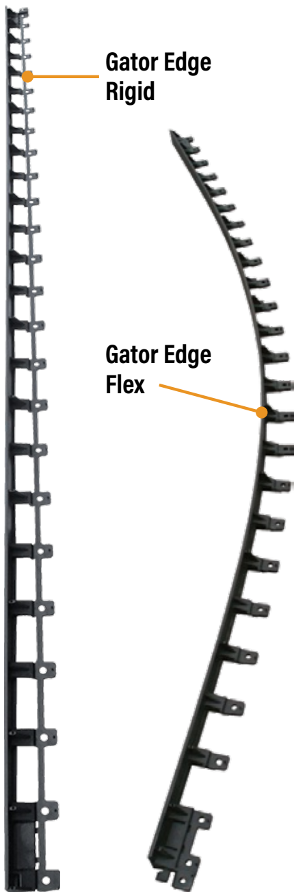
Gator Edge Rigid